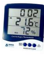
Termohigrómetro Marca: Boeco