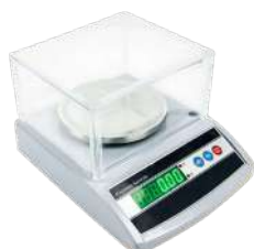
Balanza gramera Capacidad: 1 000 g