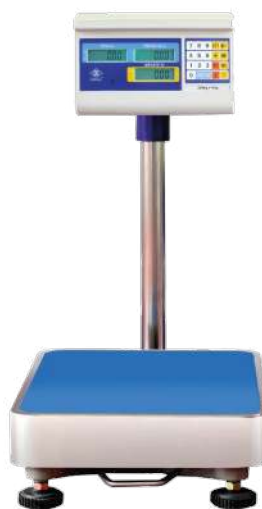
Balanza industrial Capacidad variada