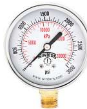
Manómetro 2½" ; 4" ; 6"