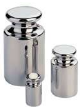
Pesa patrón clase: M 2