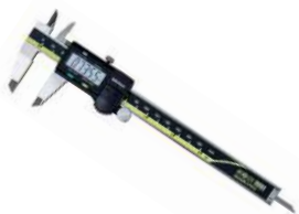
Pie de Rey Rango: 6" / 8" / 12"