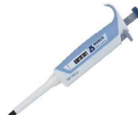
Micropipeta Marca: Boeco