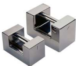
Pesa patrón clase: M 2