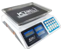
Balanza comercial Capacidad: 40 kg