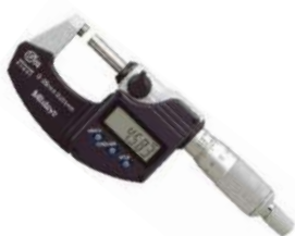
Micrómetro Exterior Rango: 0-25 mm