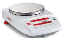
Balanza de precisión Capacidad: 150 g

PLATAFORMA CON MEDIDA SOLICITADA POR EL CLIENTE