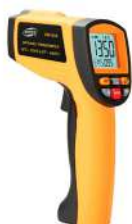
Termómetro Rango: - 40° C a 550 °C