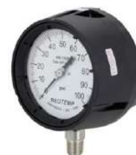
Vacuómetro 2½", 4"